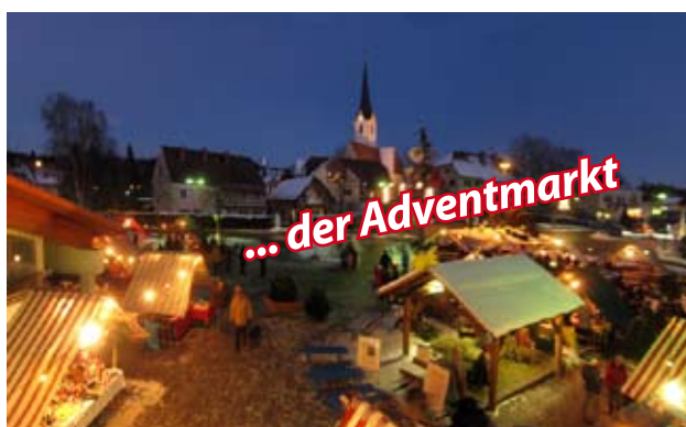
... der Adventmarkt