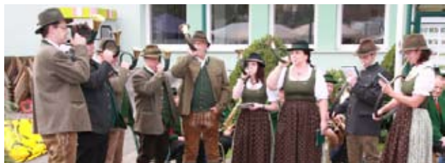
... das Marktfest