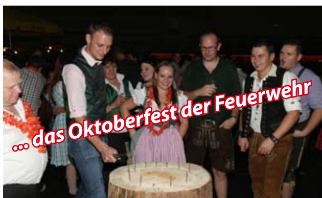
... das Oktoberfest der Feuerwehr