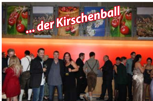
... der Kirschenball