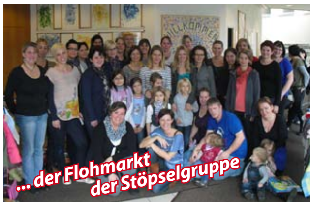
... der Flohmarkt der Stöpselgruppe