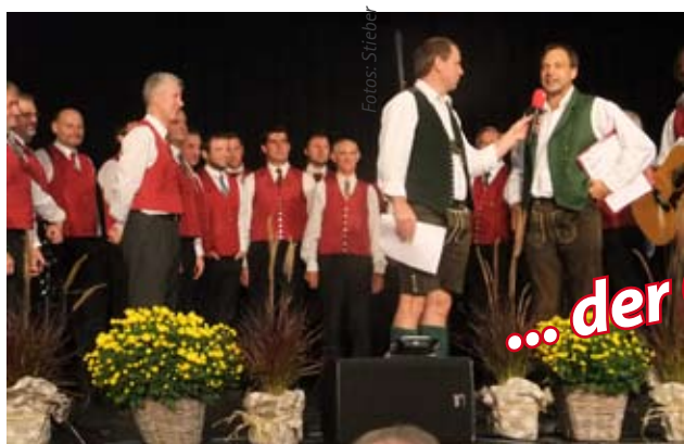
... der ORF-Frühschoppen